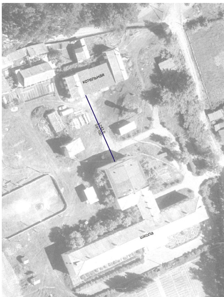
Схема 1 Тепловая сеть котельной Екатерининской СОШ